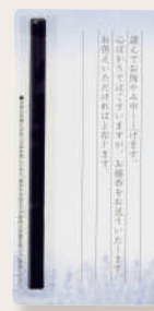
お悔みカード (線香付き)